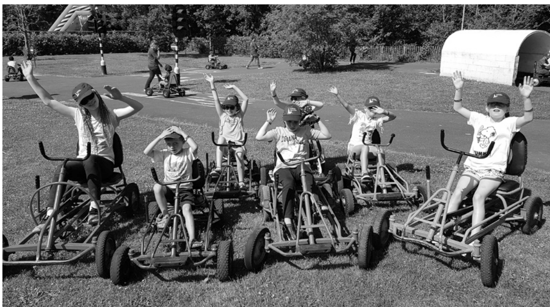
Dag 4: we hebben gedaan zoals iedereen die naar de zee gaat, met een gocart rijden !