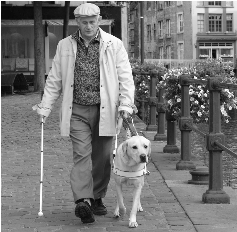
Zich verplaatsen met een blindengeleidehond.

deze proefperiode gaat de dresseur regelmatig langs om het teamwerk te evalueren en bij te sturen indien nodig. Als de opleiding niet geslaagd is, keert de hond terug naar de dresseur die de opleiding verderzet of wordt de hond in een adoptiegezin geplaatst, dat zeer blij zal zijn om zich over hem te ontfermen.