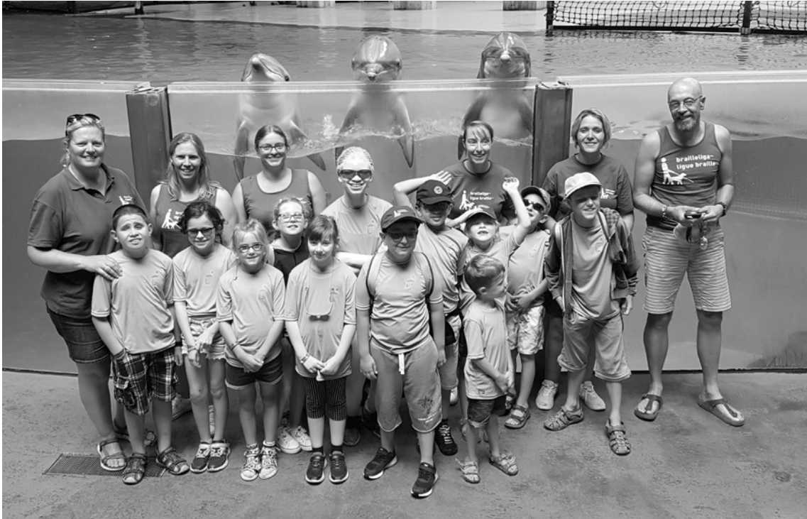
Dag 2: we zijn naar Boudewijn Seapark gegaan waar we dolfijnen mochten aaien.