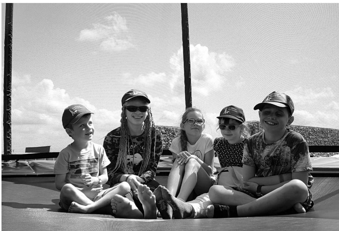
Dag 1: onder een stralende zon hadden we plezier op de trampoline.

Tijdens een vierdaagse begin juli trok de Brailleliga voor de 20 e keer naar zee met blinde en slechtziende kinderen tussen 6 en 11 jaar. Doel van de week: zelfstandiger worden in het dagelijks leven dankzij de begeleiding van de therapeuten.