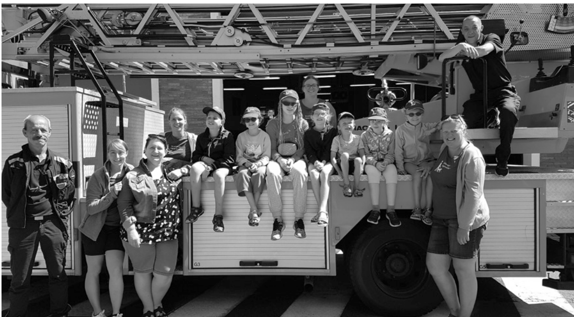
Dag 3: op bezoek bij de brandweer van De Haan. We mochten naar boven met de brandladder en mochten zelfs eens spuiten met een brandslang.