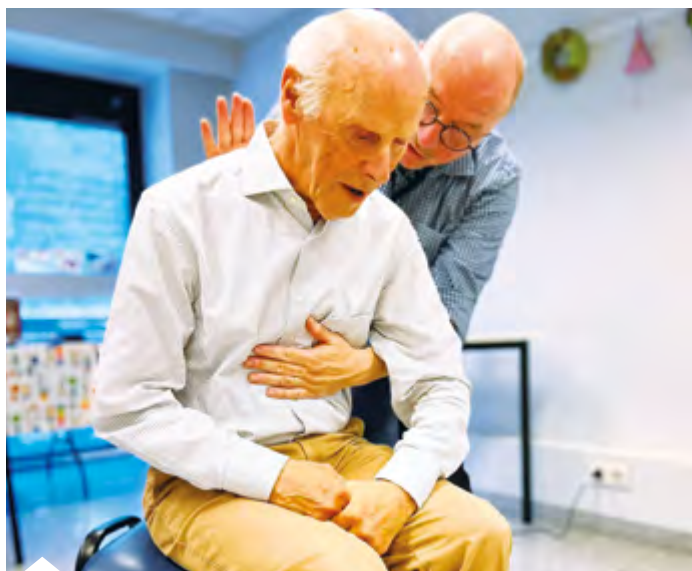
Ook de heimlichmanoeuvre komt aan bod in de sessie

De lessen blijven klassikaal, met een sterke nadruk op informatieoverdracht, vaardigheden demonstreren en ze inoefenen. De deelnemers krijgen na de sessie de inhoud van de lessen mee naar huis als audiobestand. Zo kunnen ze op hun eigen tempo de sessie herbeluisteren. Auditieve communicatie staat centraal: alle instructies zijn zorgvuldig herzien om goed verstaanbaar en duidelijk te zijn. De instructeurs hebben extra training gekregen over hoe ze het beste kunnen communiceren met blinde en slechtziende personen.